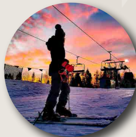
CENTRO DE SKI